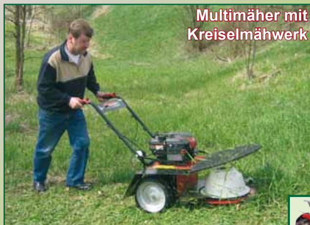
Multimäher mit Kreiselmäherwerk