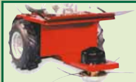
Nylonfadenmäherwerk 60 cm Schnittbreite Schnitthöhe von 25-45 mm Best.-Nr. 56 / VBM-NF60 133.-- € RG / B