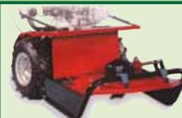
Hochgrasmähwerk 53 cm Schnittbreite Schnitthöhe von 20-80 mm Best.-Nr. 56 / VBM-HG53 269.-- € RG / B