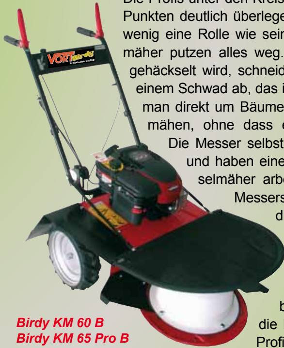
Birdy KM 60 B Birdy KM 65 Pro B

die Birdy-Kreiselmäher auch für den Profi interessant.