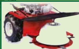
Kreiselmäherwerk 60 cm Schnittbreite Schnitthöhe von 45-80 mm Best.-Nr. 56 / VBM-KM60 359.-- € RG / B